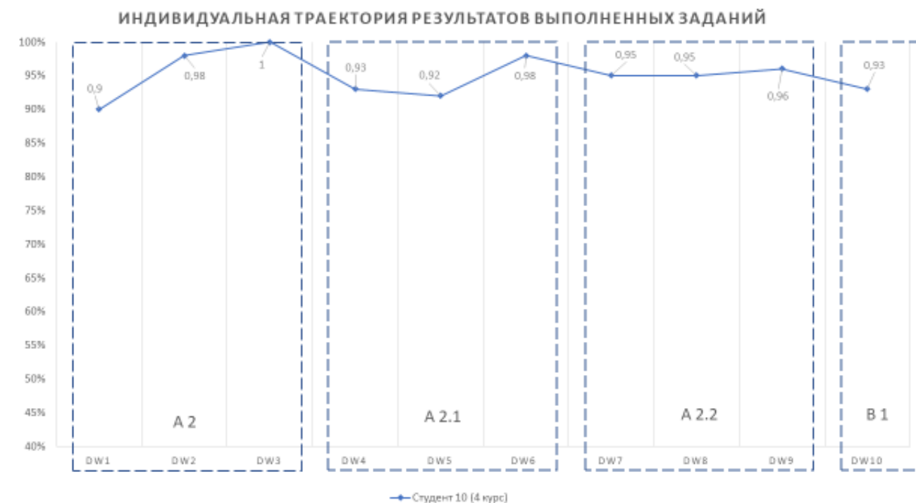
Рисунок 4. Индивидуальная траектория выполненных заданий студентом 4 курса

На рисунке 4 приведет пример индивидуальной траектории выполненных заданий студентом 4 курса в рамках модели перевернутого класса. Студенту в процессе изучения иностранного языка необходимо успешно выполнять задания, в